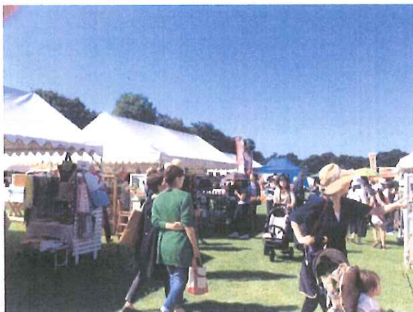
画像はくぬぎの丘マルシェ参照